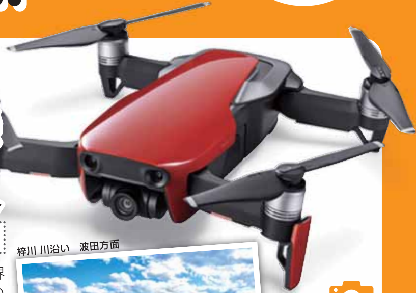
梓川 川沿い 波田方面