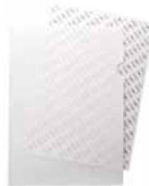
紙製クリアファイル