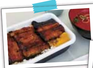
← うなぎ弁当 (お吸い物付き)

当社では、毎月末の土曜日に親睦会を行っています。内容は皆で食事をしたり体験をする等様々ですが、7月は暑い日が続いていたので土用の丑の日と土曜日を掛け、うなぎ石佳様のうなぎ弁当を美味しくいただきました。